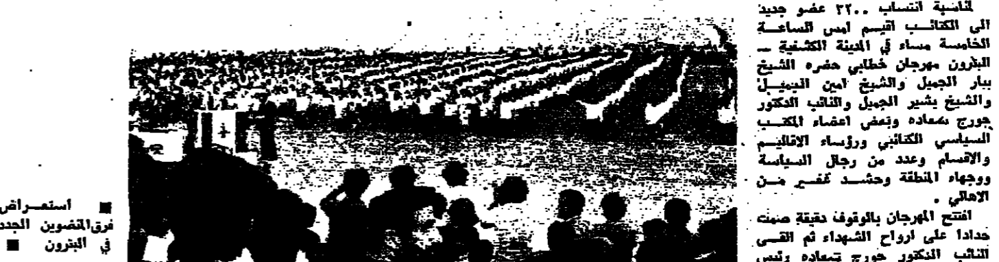
استعراض في البيرون

قائمة انتساب 220 عضو جديد الى الكتائب اقيم امس الساعة الخامسة مساء في الهيئة الكشافية - البيرون مهرجان خطابي حضره الشيخ بيار الجميل والشيخ أمين الجميل والشيخ بشير الجميل والكاتب الدكتور جورج سماعة وعضو اعضاء الكتائب السيسى الكتائبى ورؤساء الاقاليم والاقسام وعدد من رجال السياسة ووجهاء المنطقة وحشد غفير من الاهالي . افتتح المهرجان بالوقوف دقيقة صمت تخلد على ارواح الشهداء ثم القى الكاتب الدكتور جورج سماعة رئيس القيم البيرون الكتائبي كلمة لاشاد فيها بالطولات التي حقها الشباب اللبناني تحرير الارض والشعب ودعا الى تركيز الدولة المصرية القادرة على جميع الاصعدة السياسية والاجتماعية والاقتصادية والتي الى ابرز دور الكتاب التاريخي في منطقة البيرون . ثم تكلم الدكتور بطون ومعرض رئيس مجلس الشرف دعما الى ايجاد العمل النظم والتمثيل الذي يقوم على التخطيط وهذا العمل وحده كفيل بظلم لبنان . كلمة ربابي والقى الاستاذ اليسار ربابي كلمة الحزب فاشاد بالقتال وجاهم باسم الحزب ، ثم عدد المواقف اللبنانية عبر التاريخ وقال : قبل انها حرب دول ومرتقة وتبل انها ضربة لاسرائيلية موجهة ضد الدوليين وتبل انها حرب اليسار الدولي لقب نظام الحكم قبل تهافتهم المحرومين ، كل هذه الاتوار كلها . الصحة شيء لا انه كان يستطاعنا ازالة هذه الاسباب لو تحلينا بالإخلاق الريعية المحكولكنه لا وتلان سناين الاستقلال سخطنا يفتنه وطيش وغور وخذع ، وحدثنا عيادة اقل على كل البيانات وكان شعار كل فرد منا ملا يقتني ان اتهم من الدولة لا ماذا على ان اعطينا . بعد انتهاء الاحتفال قام الشيخ بيار الجميل بعرض فرق المضمون الجدد .